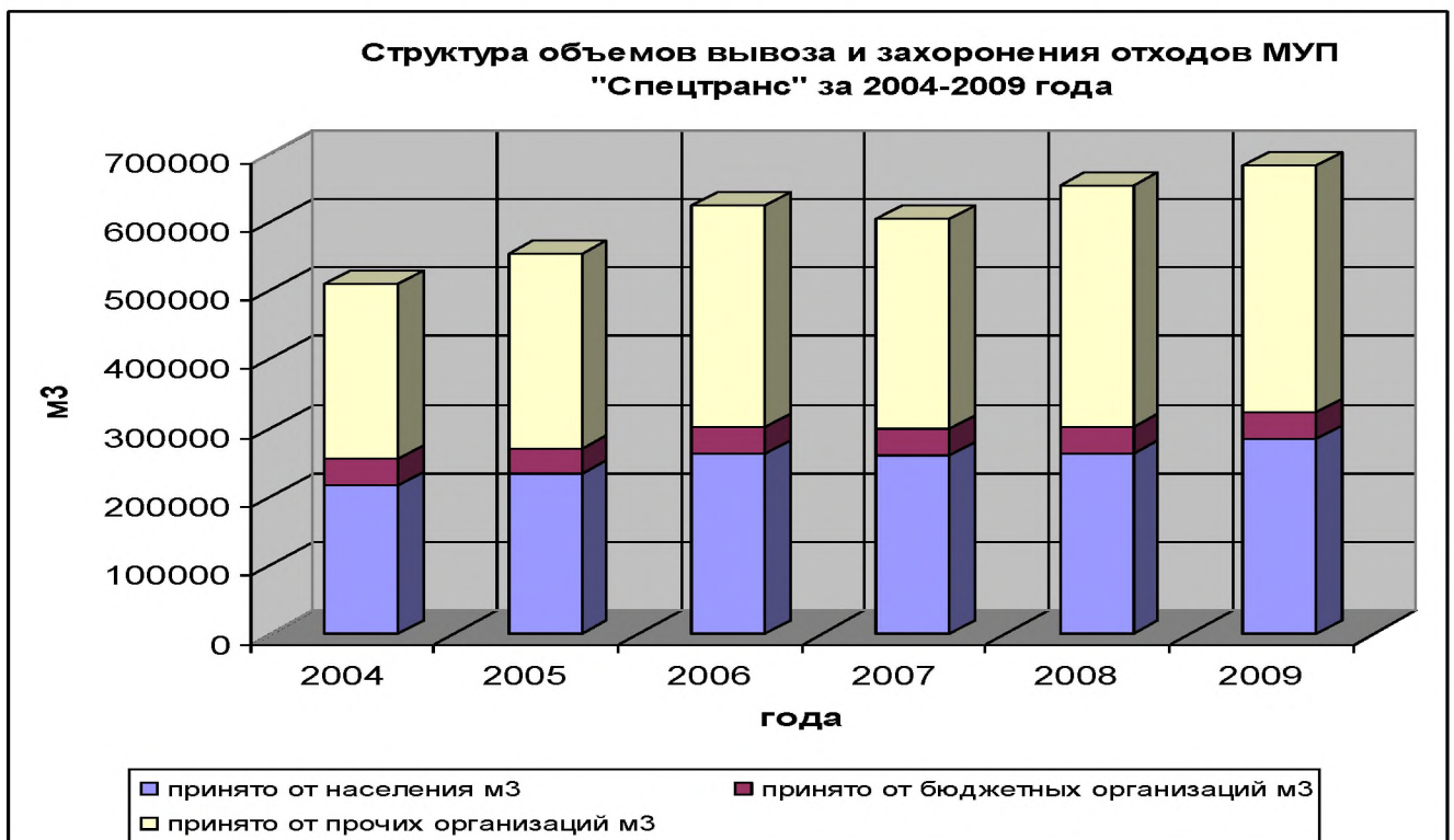
Рис.2. Структура объемов вывоза и захоронения отходов МУП «Спецтранс» за 2004-2009 гг.

При определении системы сбора и удаления ТБО и КГО на ближайший период МУП «Спецтранс» исходит из наличия современных технических средств, новых технологических схем, уровня благоустройства жилищного фонда, плана застройки, дальности вывоза ТБО.