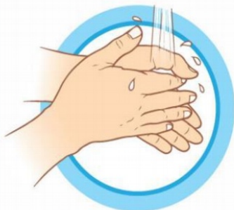
ЧАСТО МОЙТЕ РУКИ С МЫЛОМ