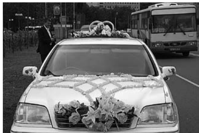
фото на память – процедура отработана годами. Сотрудники Дворца бракосочетания не стали менять сложившиеся правила и сокращать время регистрации в угоду количеству заключённых браков, они просто увеличили свой рабочий день – 8

обычно работает Дворец бракосочетания, не представлялось возможным. В среднем регистрация занимает около 15 минут. Напутственные слова регистратора, роспись в первом совместном документе супругов, обмен кольцами, поздравление родственников и друзей,