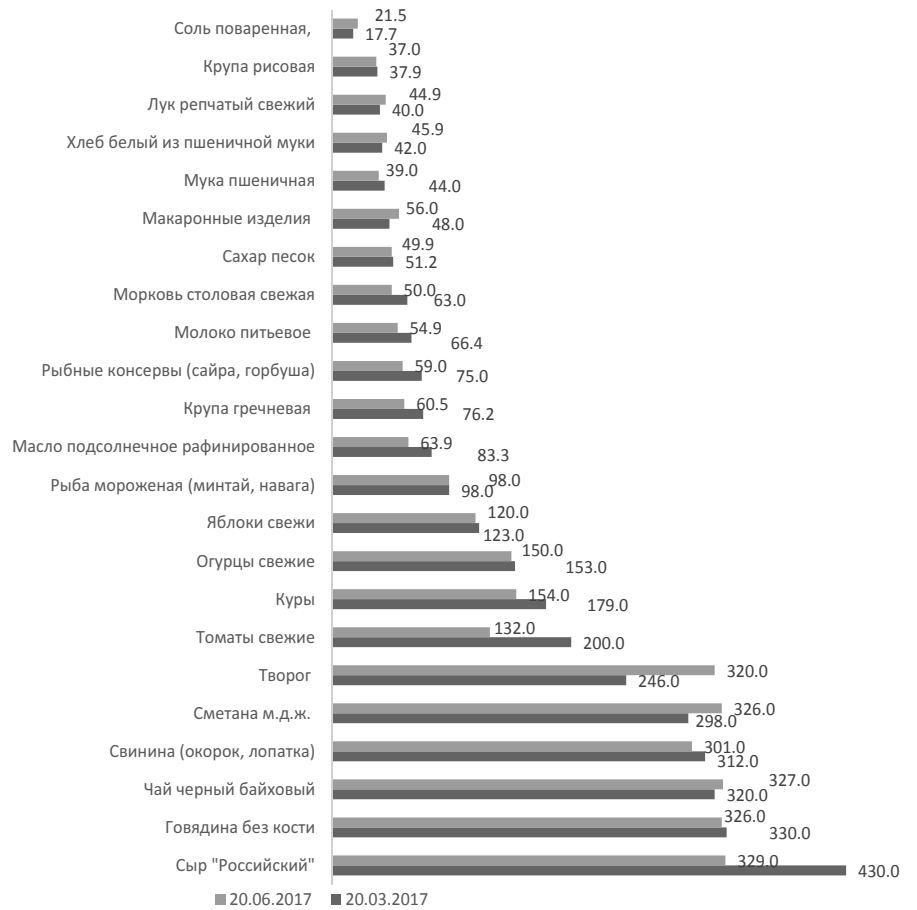
Розничные цены на основные группы товаров по состоянию на 20.06.2017 в сравнении с ценами по состоянию на 20.03.2017

АДМИНИСТРАЦИЯ ПЕТРОПАВЛОВСК-КАМЧАТСКОГО ГОРОДСКОГО ОКРУГА Управление экономического развития и имущественных отношений