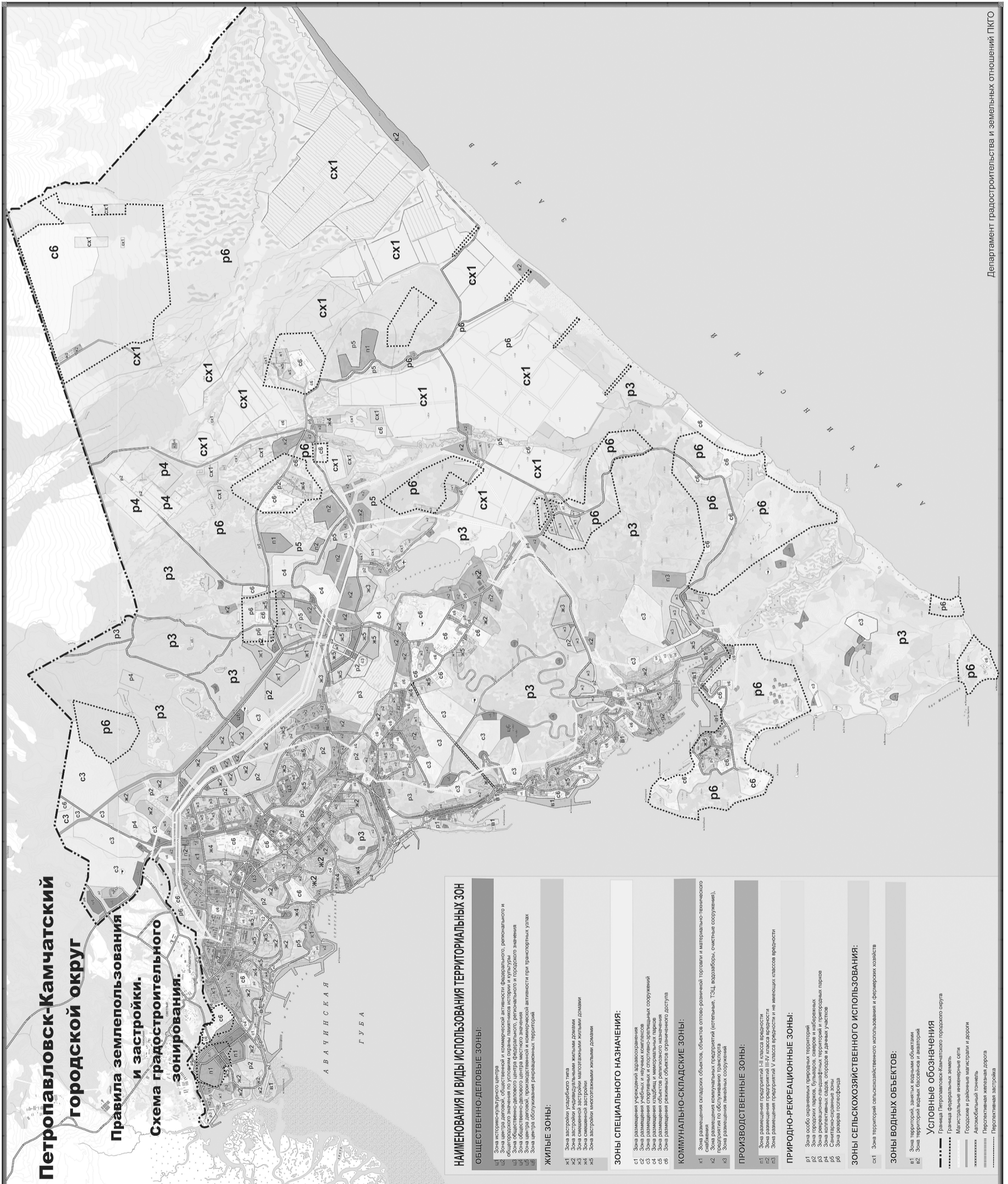
Схема градостроительного зонирования

Приложение 1 к решению Городской Думы Петропавловск-Камчатского городского округа «О Правилах землепользования и застройки Петропавловск-Камчатского городского округа» от 12.10.2010 № 294-нд