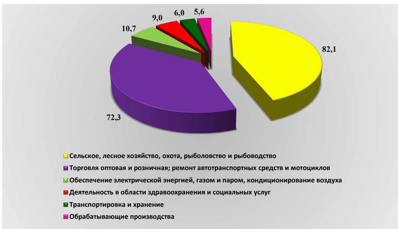
Рис. 1. Оборот организаций по видам экономической деятельности за январь – сентябрь 2024 года, млрд. рублей

Оборот организаций по видам экономической деятельности за январь – сентябрь 2024 года представлен на рисунке (далее – рис.) 1.