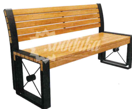
12130 Скамейка стальная «София»