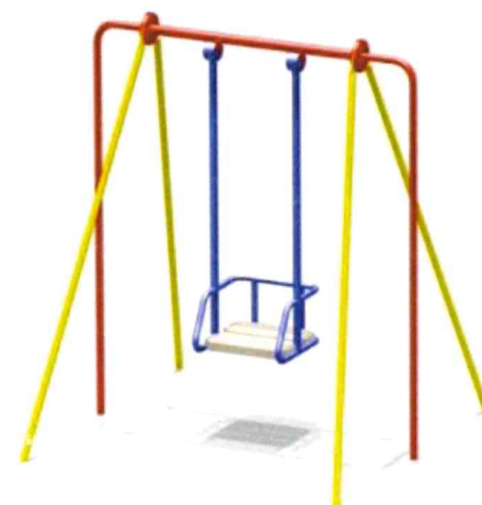
4154 Качели на метал.стойках для (рама Н=1920мм)