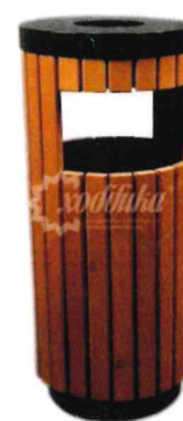
7301 Урна ПА014