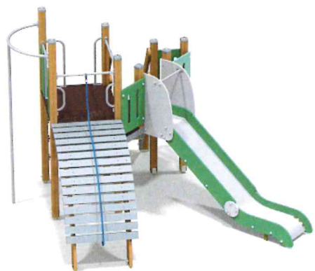
5303 Детский игровой комплекс Н г.=1,2 (нерж.)