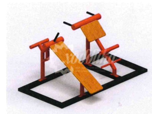
10567 Тренажер спины и пресса