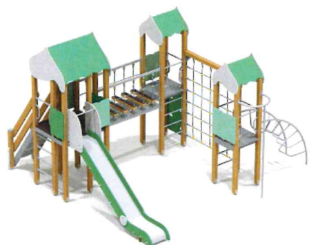
5524 Детский игровой комплекс Высота горки 1,5м