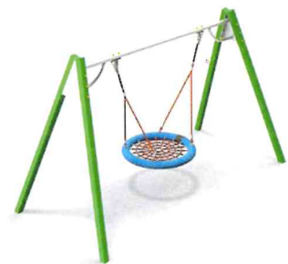
4158 Качели на металлических стойках "Гнездо»