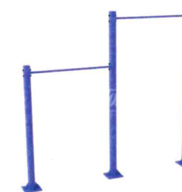
10583 Комплекс турников для подтягивания