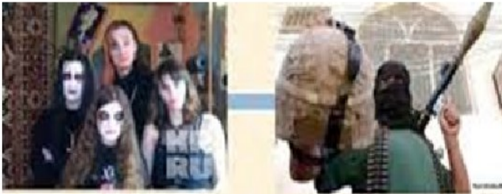
Экстремизм в подростковой среде