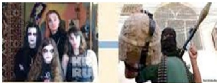
Экстремизм в подростковой среде