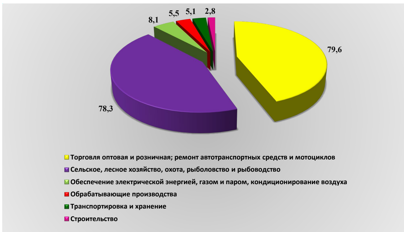
Рис. 1. Оборот организаций по видам экономической деятельности за январь – сентябрь 2023 года, млрд. рублей

Оборот организаций по видам экономической деятельности за январь – сентябрь 2023 года представлен на рисунке (далее – рис.) 1.