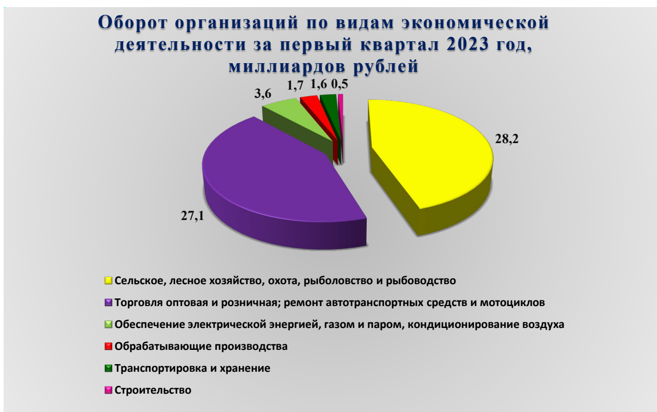
Рис. 1. Оборот организаций по видам экономической деятельности за первый квартал 2023 года, млрд. рублей

В январе – марте 2023 года оборот организаций городского округа по всем видам экономической деятельности в действующих ценах составил 70 993,500 миллиона (далее – млн.) рублей, что на 3,9 % выше уровня аналогичного периода предыдущего года. Из общего объема оборота организаций на долю организаций сельского, лесного хозяйства, охоты, рыболовства и рыбоводства приходится 39,7 %, на долю организаций оптовой и розничной торговли, ремонта автотранспортных средств и мотоциклов – 38,1 %, на долю организаций, занимающихся обеспечением электрической энергией, газом и паром, кондиционированием воздуха – 5,1 %, на долю обрабатывающих производств – 2,5 %, на долю организаций, занимающихся транспортировкой и хранением – 2,2 %, на долю строительных организаций – 0,7 %.