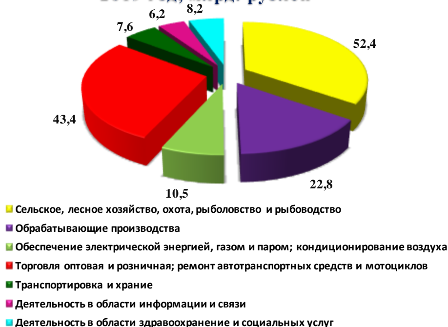
Рис. 1. Оборот организаций по видам экономической деятельности за 2019 год, млрд. рублей

Сокращение оборота по сравнению с 2018 годом имело место в следующих видах деятельности: