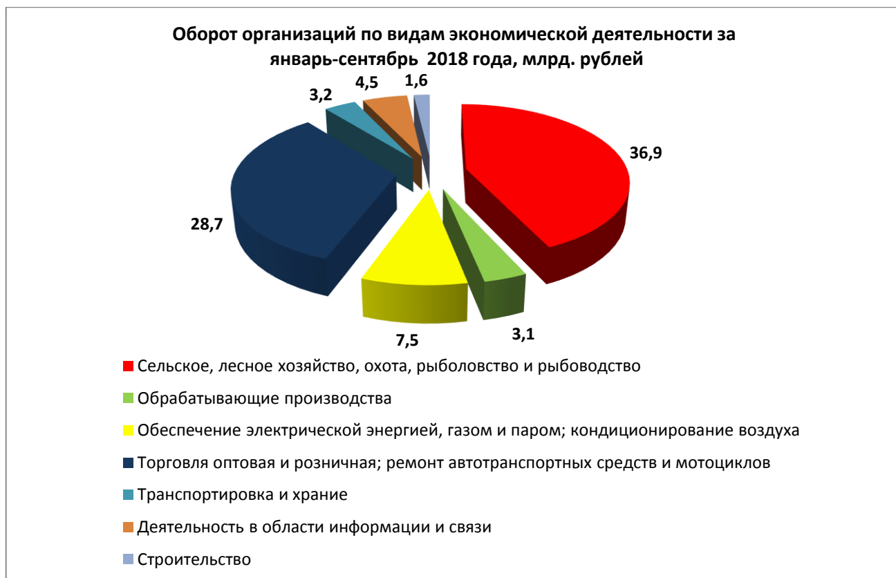
Рис. 1. Оборот организаций по видам экономической деятельности за январь-сентябрь 2018 года, млрд. рублей

В январе-сентябре 2018 года оборот организаций Петропавловск-Камчатского городского округа по всем видам экономической деятельности в действующих ценах составил 96 773,3 млн. рублей, что на 8 % выше уровня предыдущего года. Из общего объема оборота организаций на долю организаций сельского, лесного хозяйства, охоты, рыболовства и рыбоводства приходится 38,2 %; на долю организаций оптовой и розничной торговли, ремонта автотранспортных средств и мотоциклов – 29,7 %; на организации, занятые обеспечением электроэнергией, газом и паром, кондиционированием воздуха – 7,8 %.